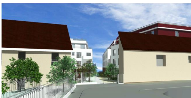
Figure 3 : vue depuis la rue des Aubépines, et création d'un nouveau passage piétonnier et arboré vers le Parc Méliès