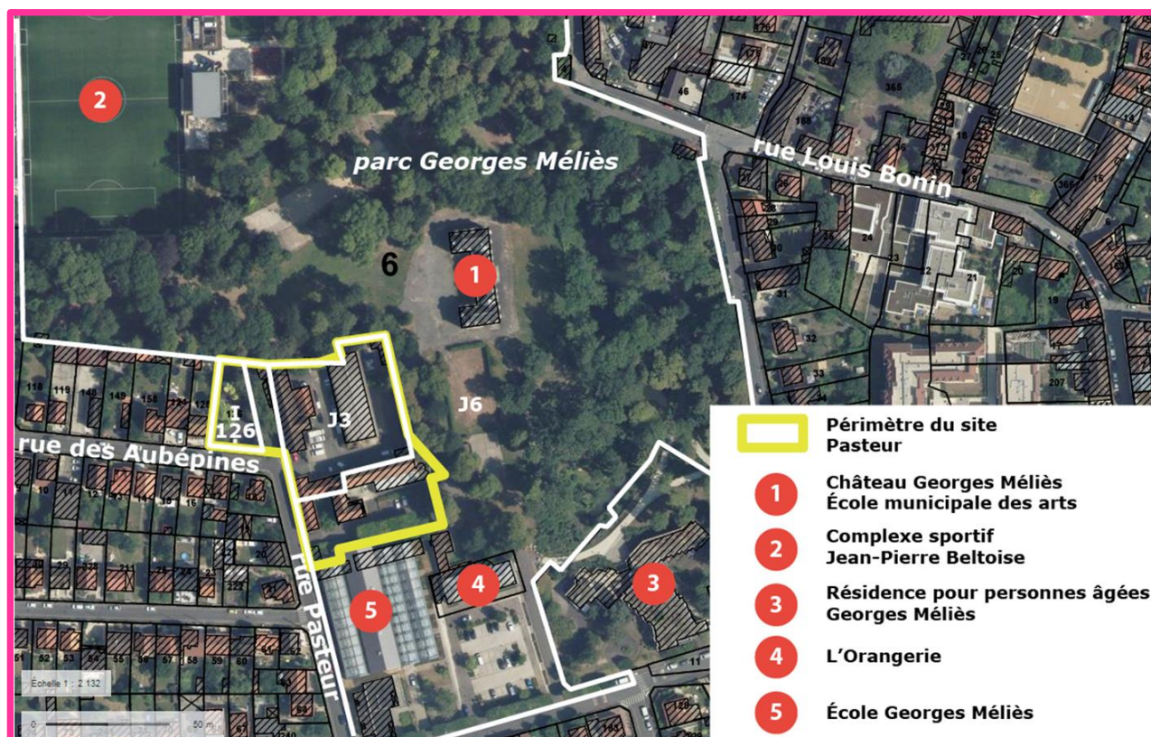
Figure 1 : Vue du périmètre du projet et des équipements et/ou sites à proximité