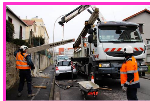
Figure 6 : dépose d'un poteau ciment

La dernière phase d'enfouissement concerne les rues de l'Aviation, Aubépines, Dr Vaillant, E Branly, Guynemer, Henri Barbusse, Parmentier, Pasteur.