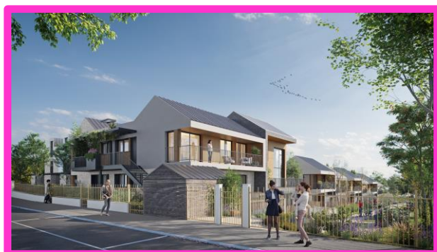
Figure 7 : vue de la future rue du Garot

Comme les autres programmes, celui-ci rompt catégoriquement l'utilisation et la ressource du terrain. En effet, aujourd'hui, les entrepôts présents et les parkings couvrent 90% des sols, contre 55% avec ses nouvelles constructions. Donc moins de béton et plus d'espaces végétalisés, une meilleure absorption des pluies, une meilleure gestion des écoulements au profit de la nature et de l'environnement en général. Le Président rappelle que cette récupération et cette fluidité des écoulements permettront d'alimenter une rivière et un bassin traité en zone végétalisée façon parc, tout à fait à l'Est de la ZAC.