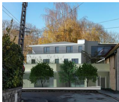
Figure 4 : vue depuis la rue Pasteur