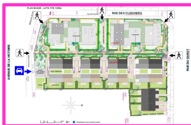
Figure 8 : Secteur aménagé rues Victoire/Flouvières/Garot