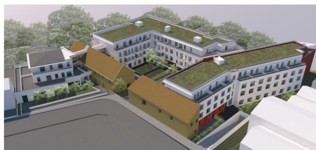
Figure 2 : vue 3D coté Aubépines/Pasteur

Les anciens locaux (ex locaux techniques de la Ville) sont quasi inoccupés, à l'exception de quelques relogements d'ateliers d'artistes à la halle aux talents.