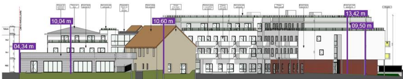
Figure 5 : coupe Ouest/Est et Résidence séniors en fond de parcelle.